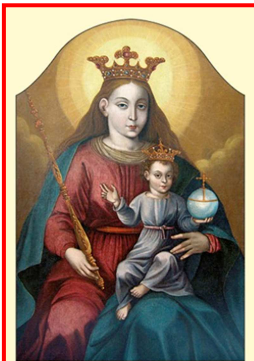
Matko Boża Kalwaryjska módl się za nami