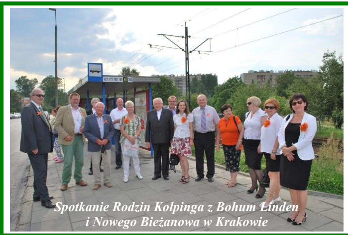
Spotkanie Rodzin Kolpinga z Bochum Linden i Nowego Bieżanowa w Krakowie

Boga i Najświętszej Rodziny na następne lata partnerstwa między naszymi rodzinami i parafiami, aby przyczyniały się do umacniania pokoju i braterstwa między narodami Polski i Niemiec w Europie narodów jednoczących się na fundamencie wartości